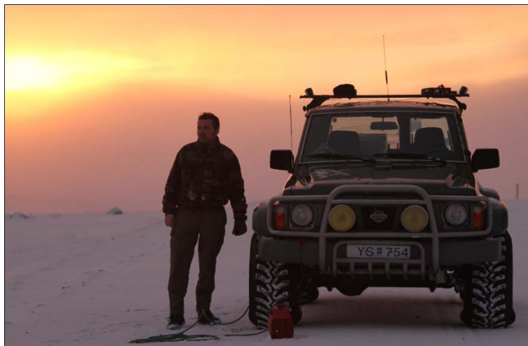
Pumpað í dekkinn eftir vel heppnaðan leiðangur 7.2.2011.