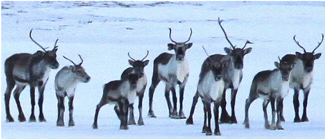
Hlíðarenda 1922 kragalaus þann 6.2.2011 austan Eyktargnípu.