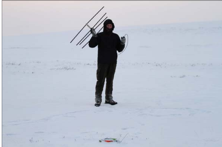
VHF sendingum kragans fylgt eftir