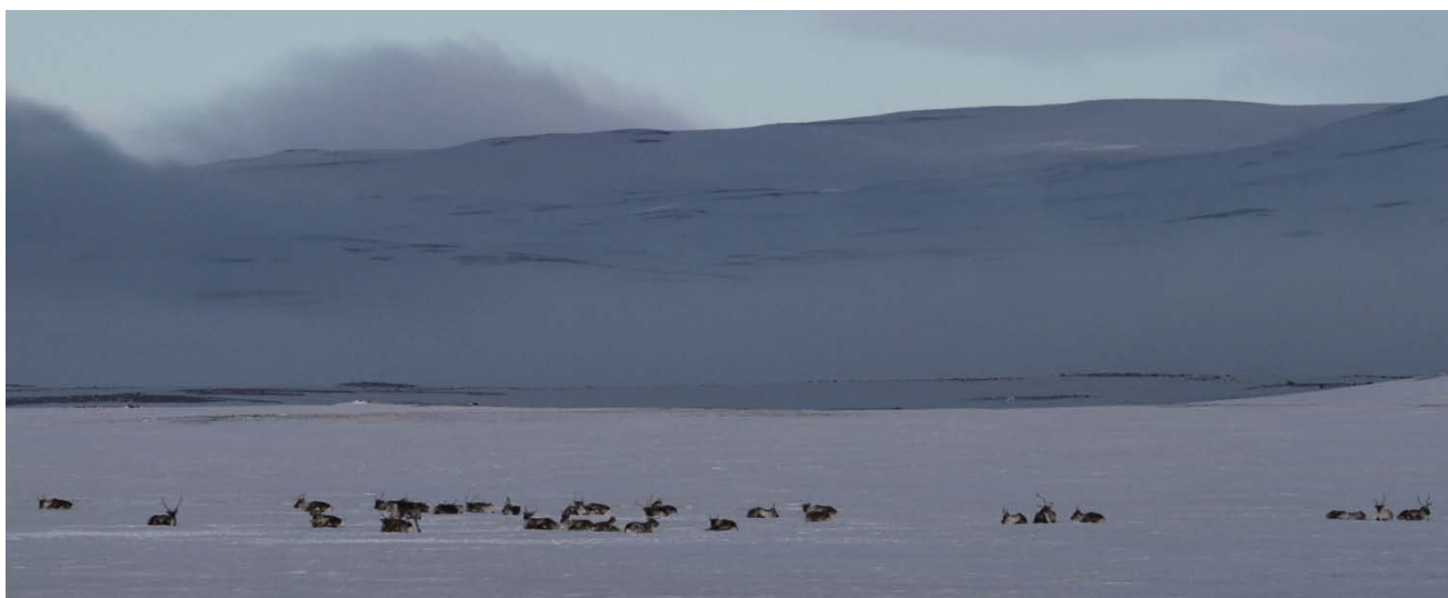
Hlíðarenda fjórða frá vinstri 2.2.2011 í Jökuldalsheiði.

Hlíðarenda hætti að senda 7.1.2011. Boð komu frá framleiðenda tækisins um að rafmagn væri orðið lítið. Þann 2. febrúar var farið í Jökuldalsheiðina. Hlíðarenda fannst í hópi austan og innan Hlíðarenda. Í hópnum 12 hyrndar kýr, 16 kálfar og 3 veturgamlir tarfar.