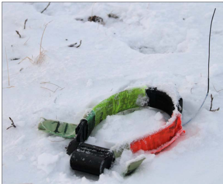
Kraginn fundinn við suðurenda Langahryggs